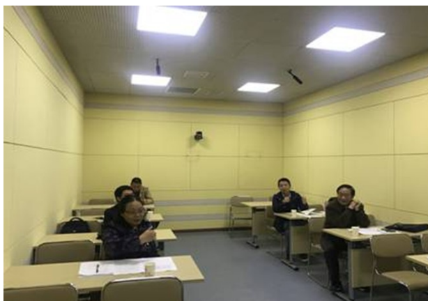
评委精彩点评现场

本次培训共回收有效调查问卷72份，100%新教师认为培训很有必要，98.6%认为培训方式较好。老师们希望中心能组织更多新老教师经验交流会、教学沙龙、名师示范课观摩、PPT课件制作、教案设计、课堂师生互动技巧学习、发声训练、校外研讨交流形式多样的活动。教师教学发展中心将于本学期继续开展提升教师教学技能的培训研讨竞赛活动，推广优秀教学经验，增强辐射效应，进一步提升全校教师的教育教学能力。