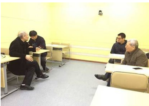
评委提出指导性意见