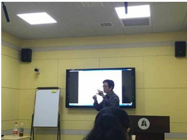
新教师生动的课程讲解