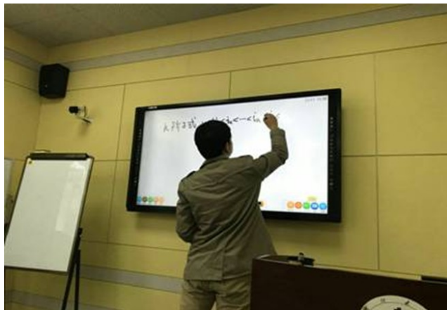
新教师运用新式设备授课